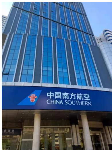
南航湖南分公司寫字樓

南航湖南分公司於 1993 年成立。經營範圍包括預包裝食品零售、航空客、貨、郵、行李運輸業務、航空器維修服務、國內外航空公司的代理業務等。本次奧園健康物業中標項目業態覆蓋寫字樓、辦公樓、教學樓、公寓等。