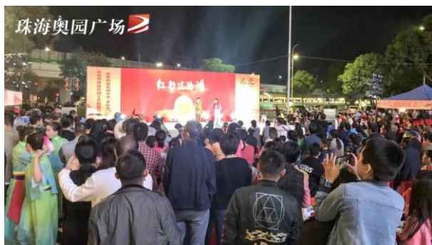
珠海首屆民間工藝品展覽活動現場

活動現場展示了 30 多個傳統民間藝術製作項目、非遺項目（手工技藝類），並提供文化表演和民間小吃，為參觀者提供融合地脈文化、城市標籤的消費體驗。